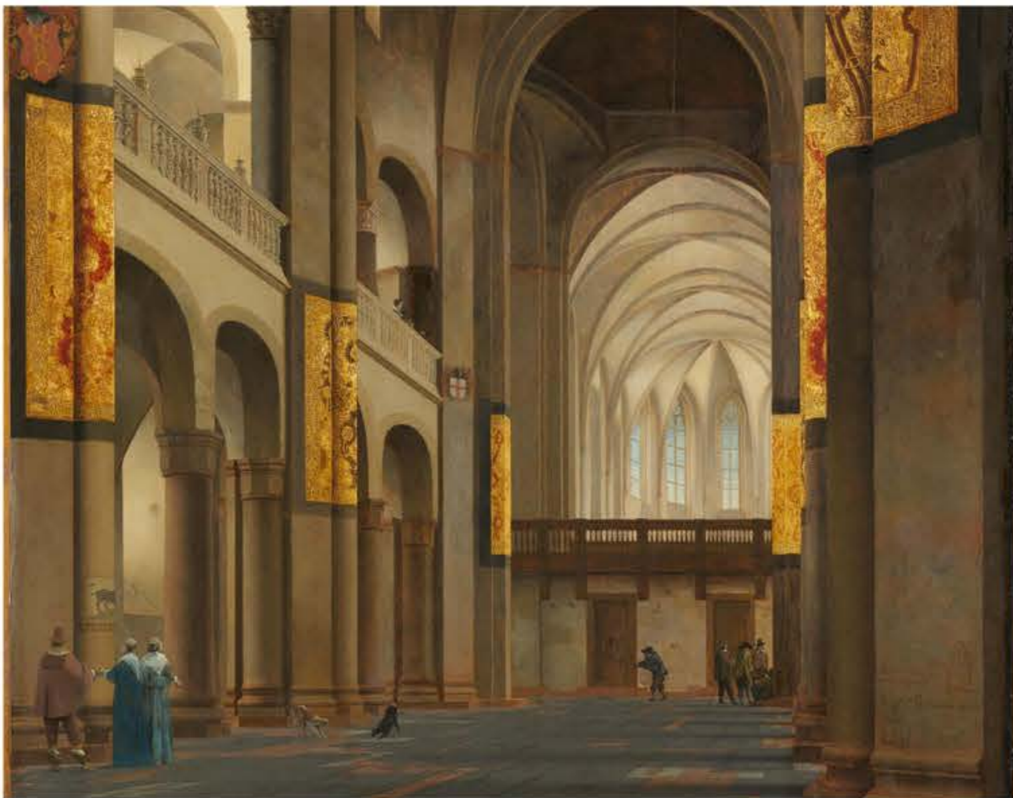
Pieter Jansz. Saenredam, Nef et chœur du Mariakerk à Utrecht , 1641, feuille d'or et pigments à l'huile sur bois, 121,5 x 95 cm, Amsterdam, Rijksmuseum (détail)

L'or et ses usages comme matériau pictural: introduction au projet AORUM