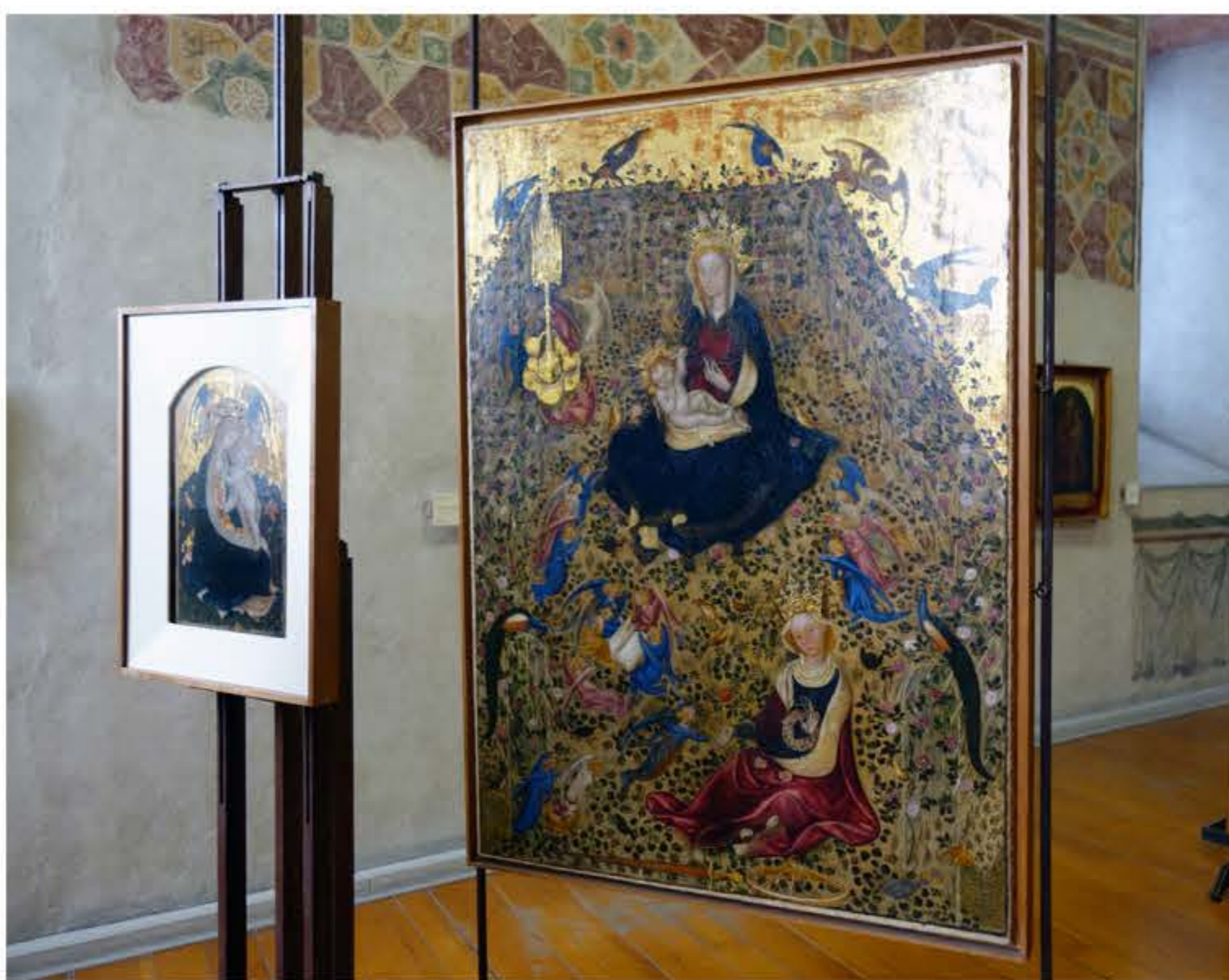
Vue d'installation permanente de la Madone à la caille de Pisanello et de la Vierge au jardin de roses de Michelino da Besozzo, muséographie de Carlo Scarpa, 1958-1964, Vérone, musée de Castelveccchio